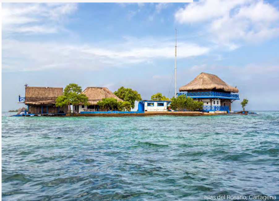
Islas del Rosario, Cartagena