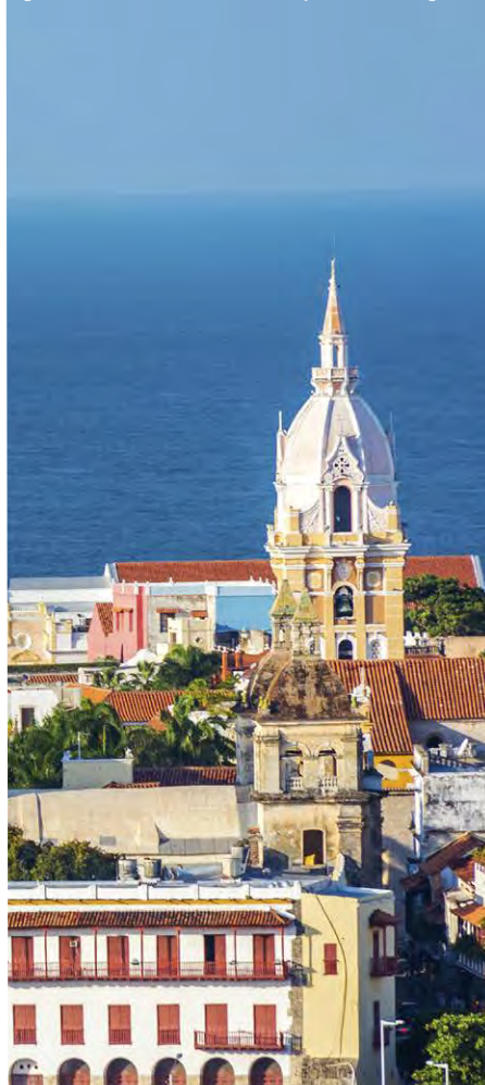
Iglesia de Santa Catalina de Alejandría, Cartagena